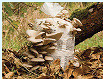
Hľiva ustricovitá ( Pleurotus ostreatus )

Hľiva ustricovitá je okrem toho zdrojom prírodnej imunomodulačnej látky beta-glukánu, ktorý sa v odbornej literatúre označuje ako „pleuran“. Aby však táto molekula mohla aktívne pôsobiť v ľudskom organizme je potrebné ju z hľivy izolovať a „očistiť“ (purifikovať).